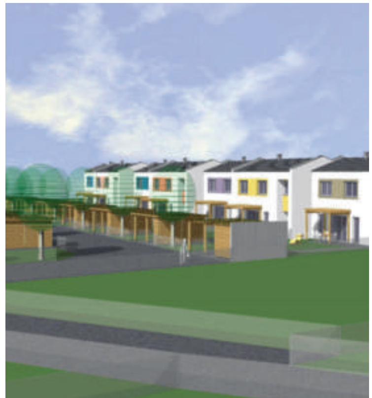
Siedlung am Avaweg. Die Anlage wird nach den neuen Richtlinien der NÖ Wohnbauförderung als Niedrigstenergiehaus errichtet. Alle Häuser sind südlich ausgerichtet.