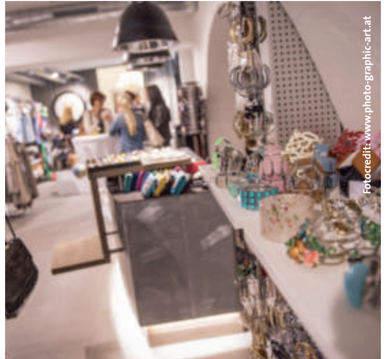
Kleidung, Accessoires und Schuhe gibt es im neuen „Fashion Store“. Shoppen macht müde. Stärken Sie sich bei einem kurzem Stop danach im Café Corrado.