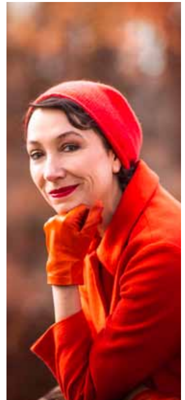
Die Schauspielerin Ursula Strauss ist künstlerische Leiterin von Wachau in Echtzeit.

Tickets und Infos. Tickets gibt es online oder von Montag bis Freitag von 9 bis 15 Uhr bei Wachau Kultur Melk in der Jakob-Prandtauer Straße 11 in 3390 Melk. www.wachauinechtzeit.at