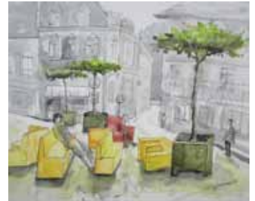
Der neu gestaltete Hauptplatz in Melk. Zu sehen bei den Malertagen in der Rathausgalerie Melk.