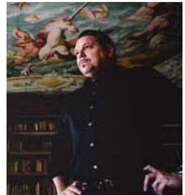
Benefizkonzert im Stift Melk am Freitag, 8. September um 19.30 Uhr. Startenor Michael Schade singt im Kolomanisaal für das Sozialprojekt „Sanioab“.

24. September Schallaburg – Tag des Denkmals von 9 bis 18 Uhr.