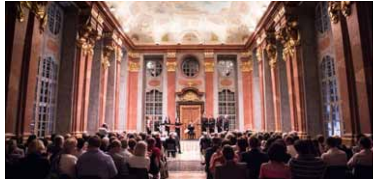
Das Stift Melk bietet seit 40 Jahren den Rahmen für die jährliche Konzertreihe zu Pfingsten.

Zur Aufarbeitung der reichen Geschichte der Internationalen Barocktage Stift Melk sucht der Veranstalter Studierende einer akkreditierten Hochschule – vorzugsweise