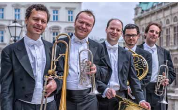
Brass-Konzert. Das Berlin Brass Quintett tritt am 23. September um 19.30 Uhr im Stift Melk im Kolomanisaal auf.