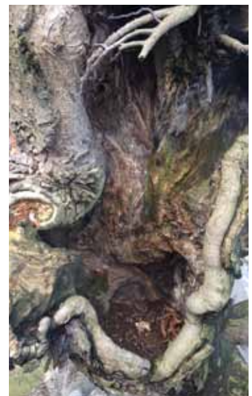
Die Fotos der Schäden lassen wenig Fragen offen. Riesige Löcher beeinträchtigen bereits die Standfestigkeit der etwa 70 Jahre alten Baumstämme.