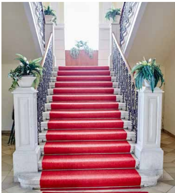
Der prachtvolle Stiegenaufgang führt zum Festsaal in der Alten Post in der Linzer Straße.

Nähere Informationen zu den Mietkonditionen gibt es im BürgerInnenCenter unter 02752-52307313.