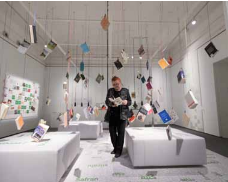
ISLAM-Ausstellung auf der Schallaburg: Vertraute Situationen des täglichen Umgangs werden als Begegnungszonen oder als Erfahrungsräume definiert.