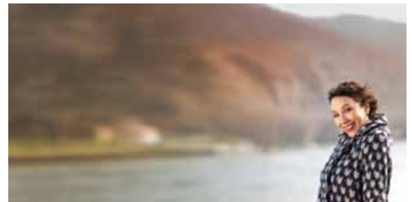
Ursula Strauss hat bereits zum fünften Mal das Programm „Wachau in Echtzeit“ auf die Beine gestellt.