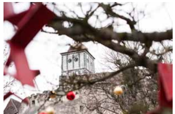
Der größte weihnachtliche Kunsthandwerksmarkt Niederösterreichs erwartet die Besucher von 8. bis 11. Dezember auf der Schallaburg.