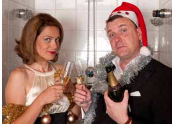
Die österreichische Kabarettgruppe „Heilbutt und Rosen“ feiern am 15. Dezember „Weihnachten unter der Dusche“ in der Tischlerei Melk.

Außerdem feiern am 15. Dezember die Kabarettisten „Heilbutt und Rosen“ ein ganz besonderes „Weihnachten unter der Dusche“. Und zum stimmungsvollen Weihnachtsangebot